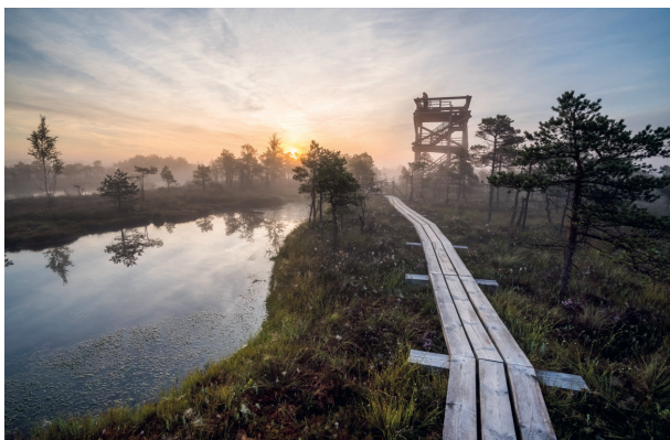
Der große Moorwanderweg Ķemeri