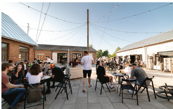
Kaļķu Street Quarter