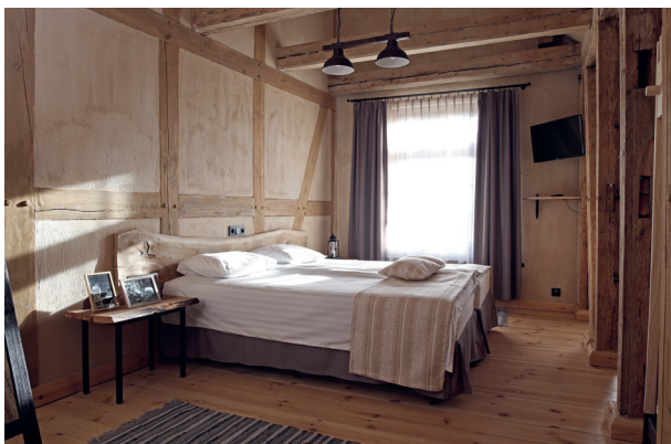
Gut Mazmežotne (Klein-Mesothern)