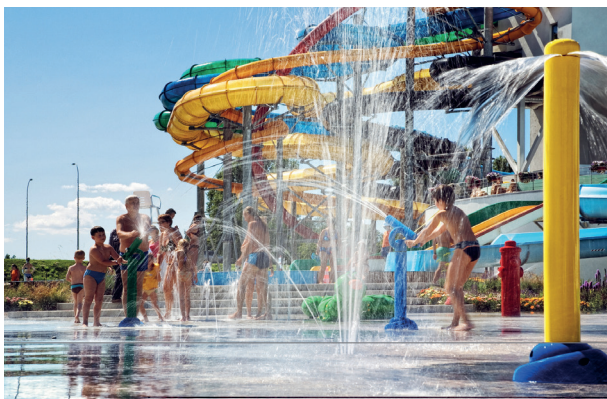
Der Aquapark „Līvu akvaparks”