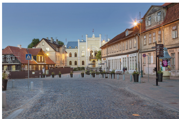
Die Altstadt von Kuldīga: UNESCO-Weltkulturerbe