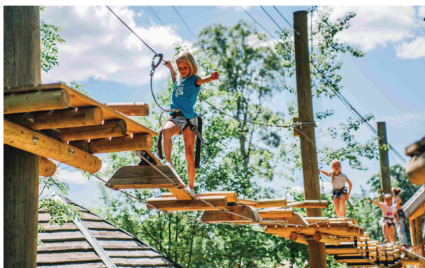
Tarzāns Adventure Park