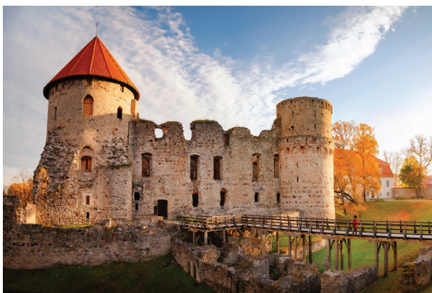
Die Mittelalterburg Cēsis (Burg Wenden)