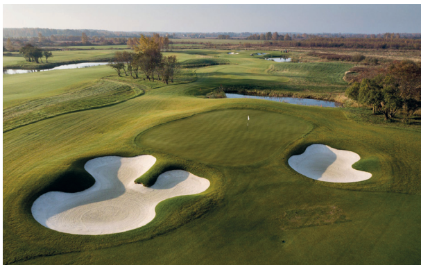
Jūrmala Golf Club & Hotel