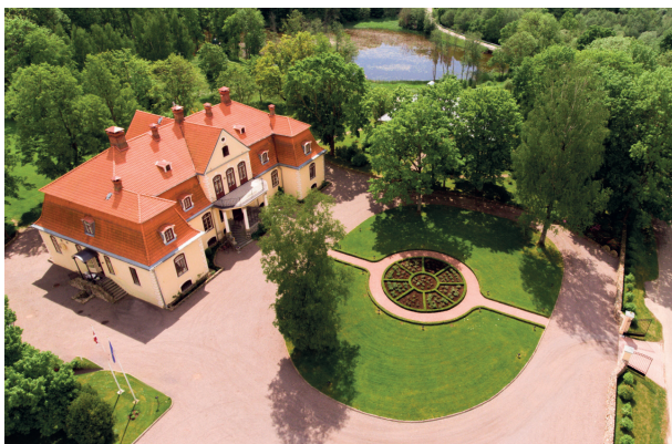
Gut Liepupe (Pernigel)