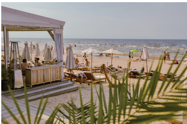
Strand von Jūrmala