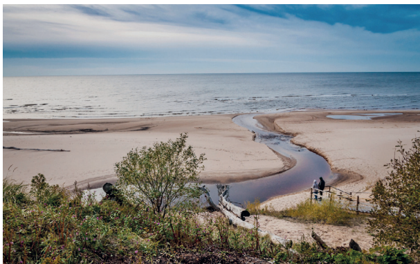
Strand von Saulkrasti an der Weißen Düne