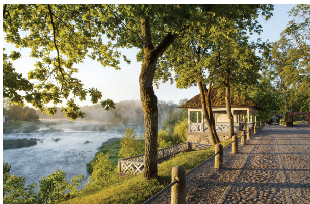
Wasserfall Ventas Rumba