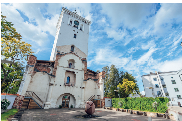
Turm der Heiligen Dreifaltigkeitskirche